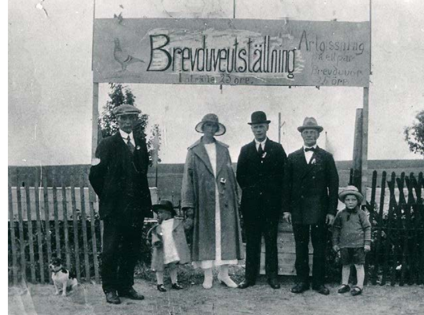
Bild ur förbundets historia: Brevduveutställning 1924 i Svalöv. Inträde 25 öre.

duvor. Det var under andra världskriget då fadern var ute på stenarbeten i Bohuslän.