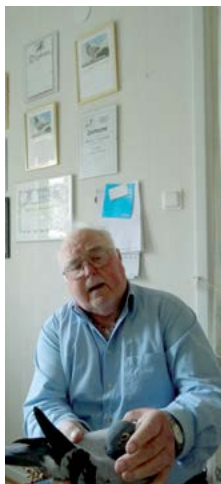
SIVER HEDARP GÖTEBORGS BREVDUVE- DISTRIKT