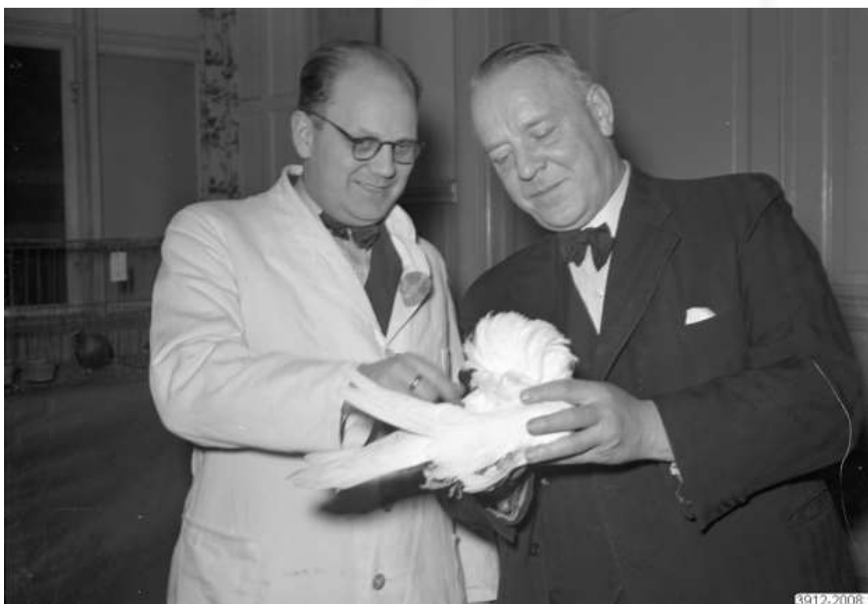
Kombinerad utställning av brevdovor och utställningsduvor i Folkets Hus i Hbg 1945. Här gör domarna en sista bedömning innan prisutdelning.