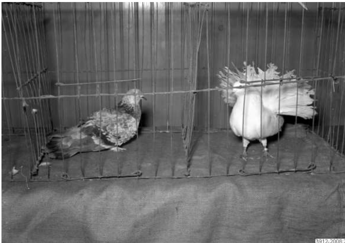
Jag kan tyvärr inte namnen på dessa duvarter. Året är 1945.