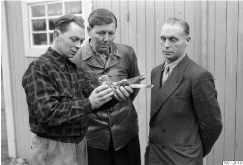
3 medlemmar diskuterar vinnarens kvalitet. Från 1953