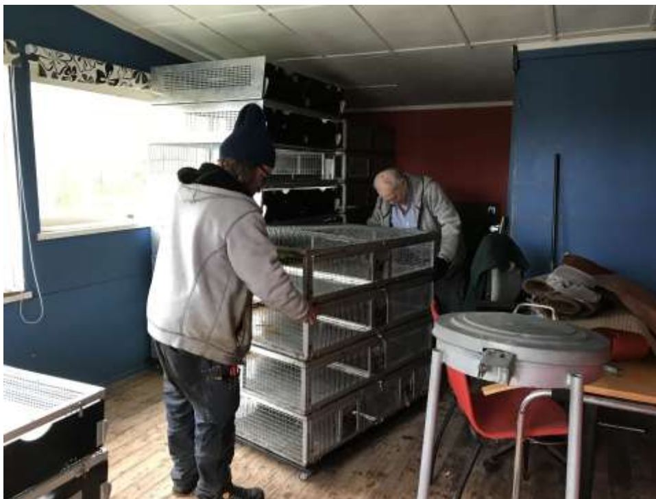
Arbetet i full gång med rengöring, sätta alla burar på plats mm. År 2020