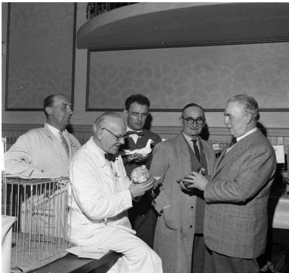
Kombinerad utställning i FH i Hbg 1960