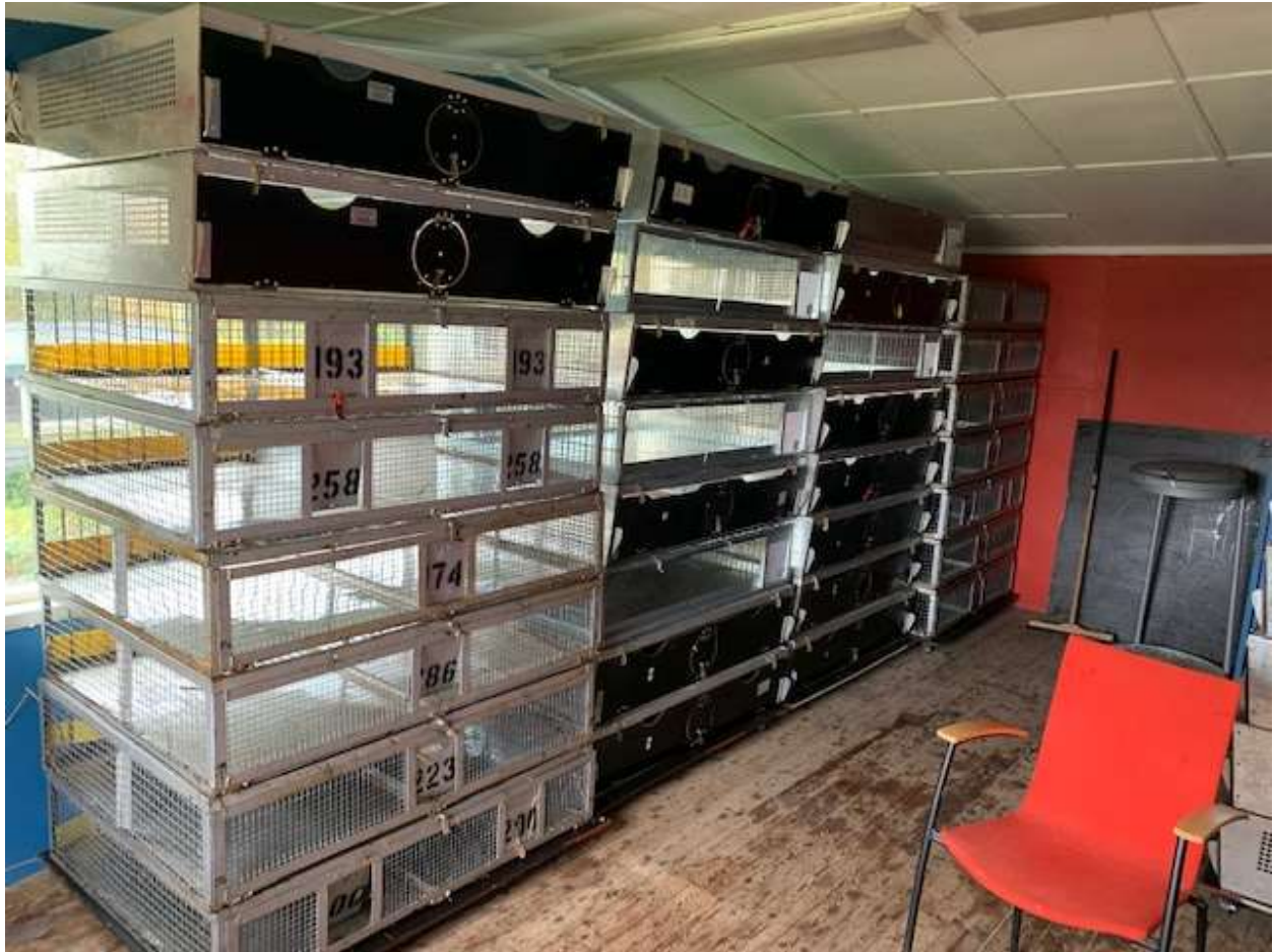
Så här rent och fint blev det efter rengöringen i packrummet hos oss!